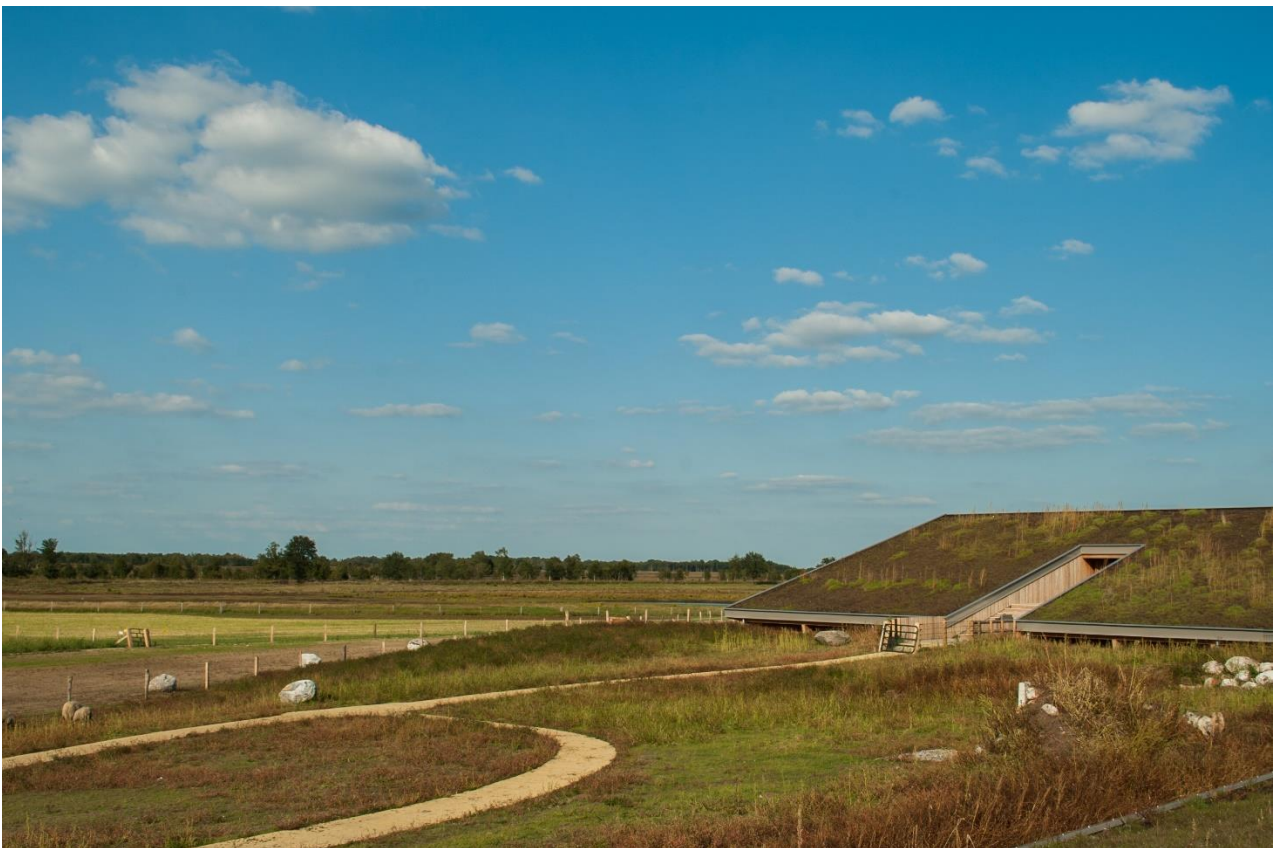
Kwaliteit voor mens, dier en omgeving.