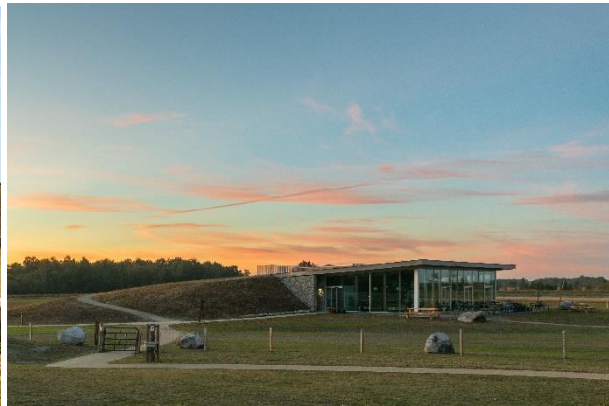
Bebouwing geïntegreerd in het landschap