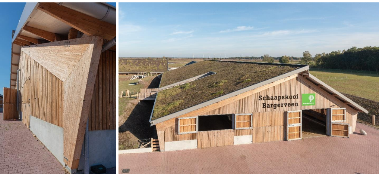
Houtskelet en groene daken

Zo is een leefomgeving gecreëerd waar mens en dier zo harmonieus mogelijk samenleven, in evenwicht met de omgeving. Dit geldt zowel voor de grote als kleine schaal: zo heeft de houten skeletbouw een lage milieubelasting en dragen de groene daken bij aan de klimaatbeheersing van de gebouwen. De open houten gevel en de open nok zorgen voor een gezond leefklimaat voor de grazers, terwijl er tussen de gelamineerde houten spanten in de gevel nestkasten zijn geplaatst voor dieren van buitenaf.