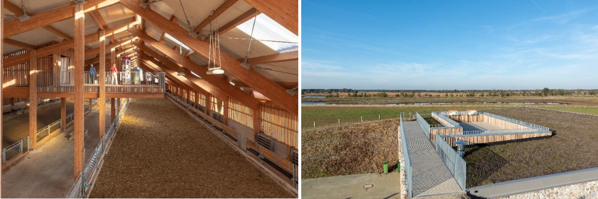
Beleving van de bedrijfsvoering en het landschap

Het even verderop gelegen restaurant is eveneens verdiept in het landschap aangelegd en door de grote glazen puien is de natuur overal zichtbaar. Vanaf het op het restaurant gelegen panoramaterras, bereikbaar via het talud, hebben bezoekers een prachtig uitzicht op het Bargerveen en de schapendrift, om bijvoorbeeld de schapen huiswaarts te zien keren na een lange dag graaswerk.